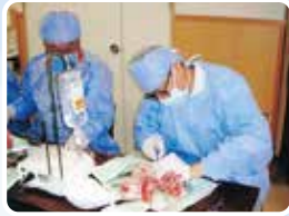
インプラント埋入実習