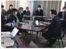
専修医取得試験の準備